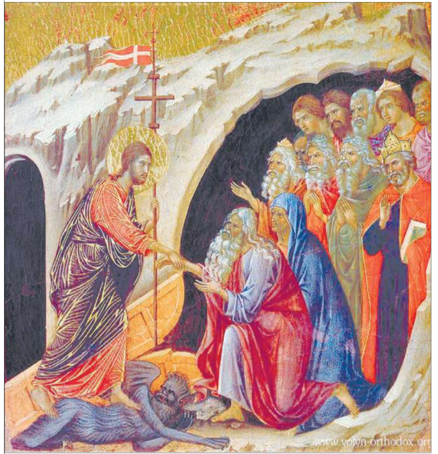
Фрагмент ікони Воскресіння Господнього.