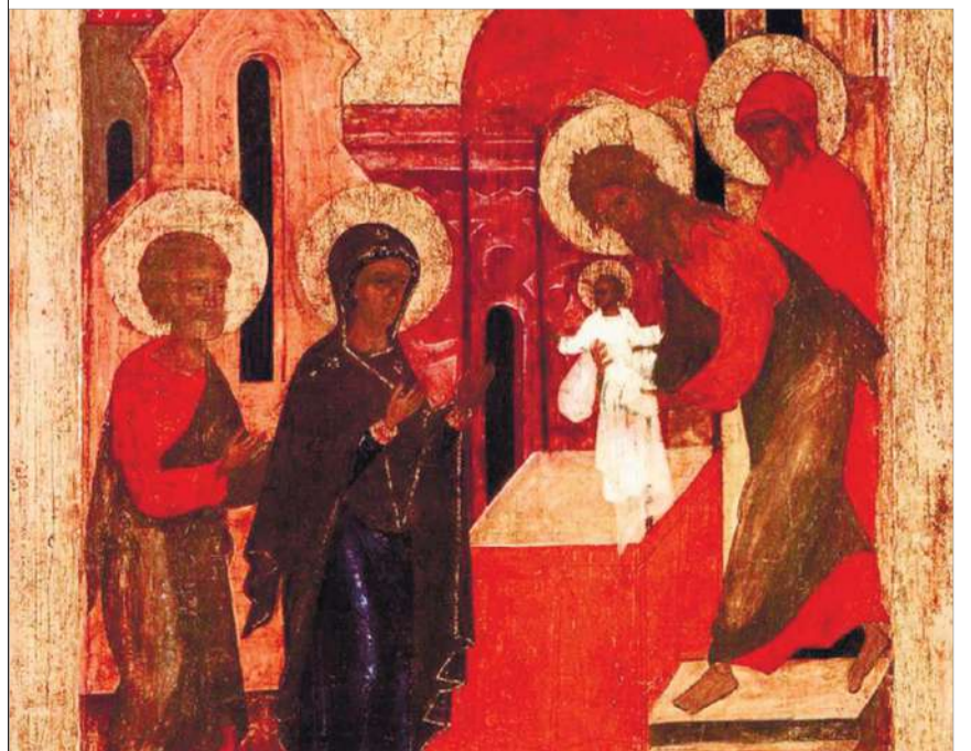
Фрагмент ікони Стрітіння Господнього.

28 чт Ап. від 70 Онисима (бл. 109). Прп. Пафнутія, затворника Печерського, в Дальніх печерах (XIII). Віленської (перенесення у Вільно в 1495 р.) і Далматської (1646) ікон Божої Матері.