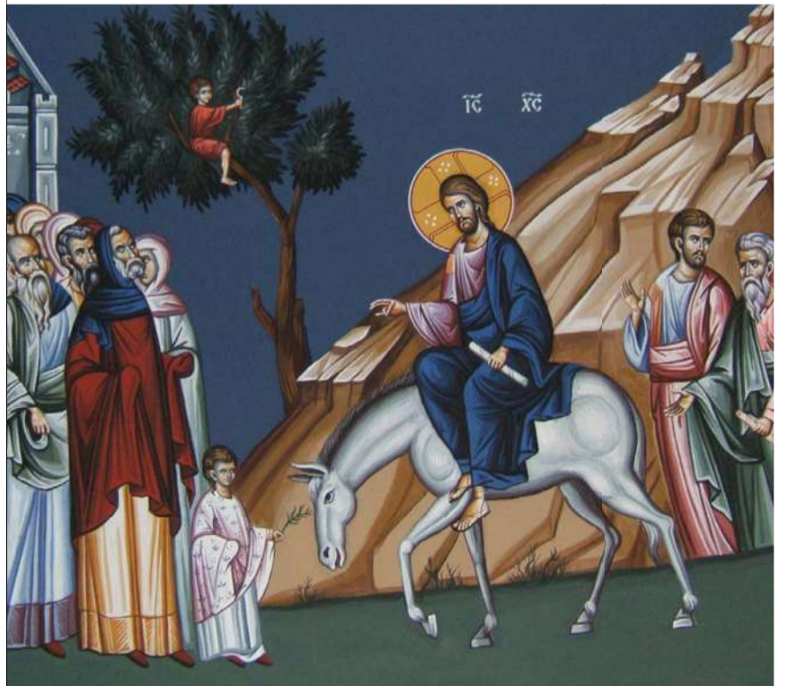
Фрагмент ікони Входу Господнього до Єрусалима.