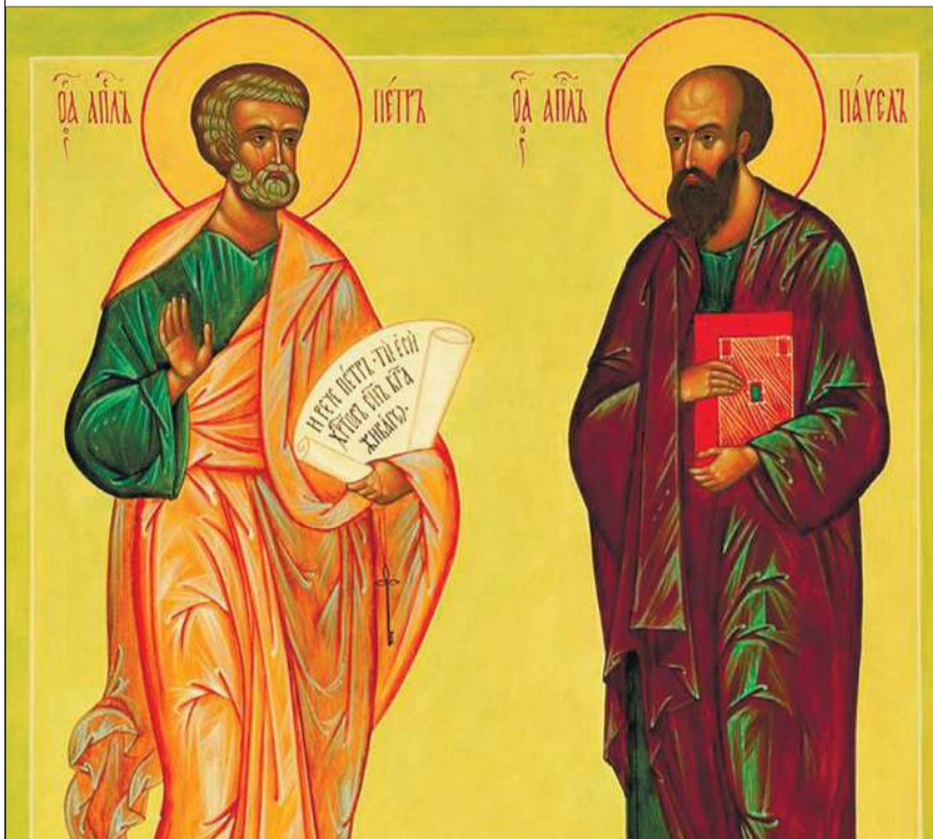
Фрагмент ікони первоверховних апостолів Петра і Павла.