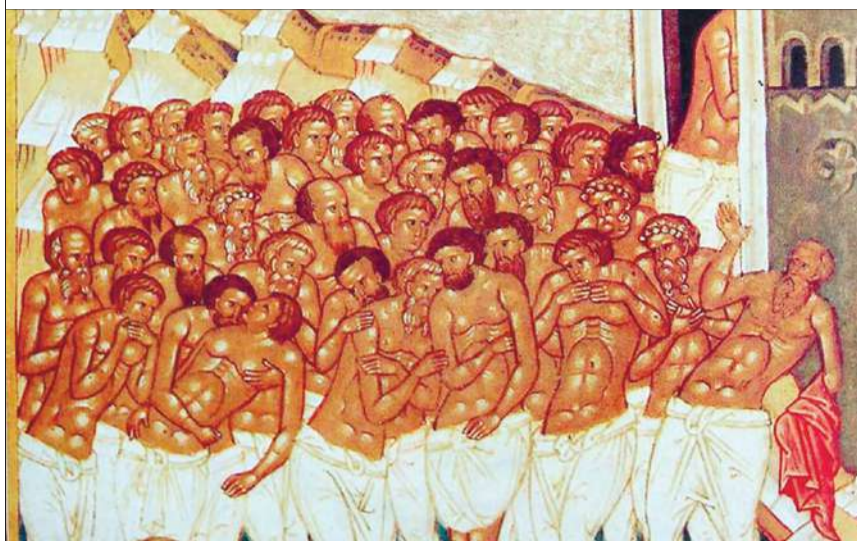
Фрагмент ікони сорока Севастійських мучеників.